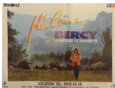
1 ère version de l'affiche

L' affiche du spectacle , support de promotion indispensable pour attirer le public, est diffusée dès le mois de septembre. Pour la première version, Hélène est dans une prairie avec en arrière-plan un guitariste et des chèvres. Quelques semaines plus tard, une seconde version, définitive et qui accompagnera toute la tournée, est diffusée : il s'agit de la même photo que pour la pochette de l'album sorti fin 1994. Les deux clichés sont issus d'une même séance photos, organisée en juin 1994 dans le Luberon, avec le photographe Benjamin Auger.