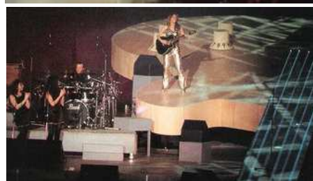
L'immense guitare de 24 mètres de long, conçue par les décorateurs d'AB Productions

Le décor a été conçu par les décorateurs d'AB Productions, dirigés par Yves Pires, et c'est Fred Poupon qui a été chargé de sa construction. Il s'agit d'une gigantesque guitare de vingt-quatre mètres de long et plus de dix mètres de large (celle qui suit la tournée est deux fois plus petite mais néanmoins très impressionnante avec douze mètres de long et cinq de large). Au début de chaque spectacle elle surplombe les musiciens. Derrière elle, des faisceaux de lumière de toutes les couleurs l'enrobent et la font paraître encore plus grande. Sur les côtés, d'autres guitares suspendues se balancent tout autour de la scène. Des lasers lumineux se baladent dans la salle, baignant tour à tour les instruments et les visages de la foule.