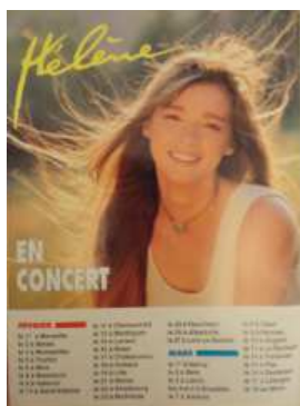
Les dates des concerts publiées dans le Dorothée magazine

Hélène garde plein de bons souvenirs de cette grande tournée, pourtant parsemée de quelques petites embuches... Le samedi 14 janvier, lors de la toute première représentation du spectacle, Hélène eu un malaise... « En voyant tous ces enfants devant moi ce soir, qui criaient mon nom, j'ai été tellement émue, je me suis sentie envahie d'un sentiment de bonheur tellement fort, que je n'ai pas pu contrôler mes émotions » déclarait-elle au journal télévisé de 20h, le soir même.