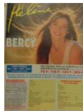
Bon de commande

A la radio c'est principalement Europe 1, radio partenaire, qui diffuse des annonces. La presse est également un bon moyen de relayer l'évènement : Hélène fait régulièrement la une des magazines, et chacune de ses interviews est l'occasion de parler de ses spectacles à venir. Les magazines « AB » ( Dorothee magazine et Télé Club Plus ) quant à eux publient des formulaires de réservation par correspondance pour les spectacles de Bercy dès le mois de novembre, puis la liste des dates de tournée à partir du mois de janvier. Quant aux membres du Club Dorothee ou du Fan Club Hélène, ils peuvent profiter d'un tarif préférentiel (entre 15 et 30 Francs de réduction par place, selon la catégorie choisie) sur le prix des billets pour les concerts de Bercy.