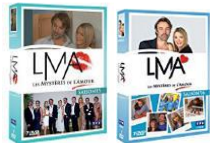
Coffrets DVD des saisons 15 et 16

Vous pouvez les précommander dès aujourd'hui dans la rubrique « Boutique » de notre site, et ainsi les recevoir dès leur sortie.