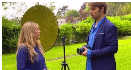
Série « Les mystères de l'amour » Saison 13, épisode 5

La séance de photos destinée à la réalisation de la pochette de l'album est, comme chaque étape de la conception du disque, mise en scène dans le 5 ème épisode de la saison 13. C'est le personnage de Nicolas, photographe professionnel ( même s'il ne travaille pas beaucoup ☺), qui immortalise son amie. Mais les décalages entre la réalité et la fiction font que ce n'est qu'en septembre que la séquence est diffusée. Tout laisse penser que, de toute façon, le tournage n'a pas eu lieu lors de la « vraie » séance photo, mais qu'elle a été entièrement reconstituée ensuite pour l'intrigue.