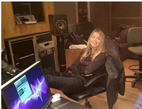
Hélène entre en studio son et commence à travailler sur un nouvel album...

L'année 2016 commence avec des projets plein la tête pour Hélène ! Tout juste de retour de Chine où elle a donné, en novembre et décembre 2015, une série de concerts entre Shanghai et Pékin, elle entre rapidement en studio pour préparer de nouvelles chansons. Le début de l'enregistrement de son nouvel album est annoncé le 25 février par son producteur, Jean-Luc Azoulay, qui publie sur les réseaux sociaux une photo où on peut l'apercevoir devant la table de mixage.