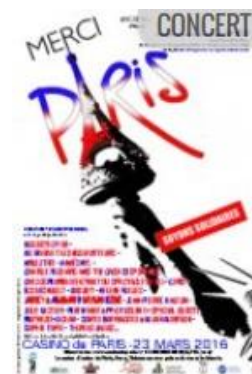
Affiche du concert « Merci Paris » prévu le 23 mars 2016

Héléne devait se produire sur la scène du Casino de Paris pour un concert solidaire, présenté par Jacky et avec de nombreux artistes, chanteurs, danseurs et comédiens. Prévu le 23 mars à 20h, il fut finalement annulé. L'argent récolté devait être reversé au profit des Invalides pour l'amélioration de la prise en charge des victimes des attentats du 13 novembre 2015.