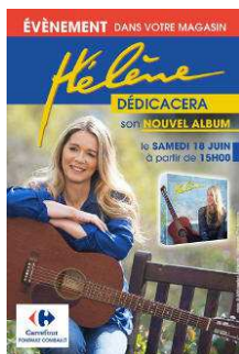
Affiche annonçant la séance de dédicaces

Lorsque les résultats de la première semaine de vente sont annoncés, on apprend que le disque s'est classé en 5 ème position du top album France , juste après Christophe Maé, Renaud, Niska et The Kid United. Il est en 5 ème place du top album physique, en 24 ème position du top album téléchargé. Les ventes s'élèveraient ainsi à un peu plus de 6 400 exemplaires, un chiffre qui comptabilise les pré-commandes faites les semaines précédentes sur internet.