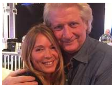
Hélène aux côtés de Patrick Sébastien le 4 avril 2016 lors des répétitions de l'émission « Les années bonheur » (France 2)