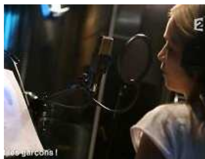
Photo extraite du reportage diffusé dans « C'est au programme » sur France 2