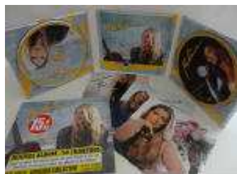
Présentation du coffret vendu en exclusivité dans certains magasins de l'enseigne Carrefour