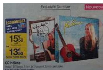
Encart publicitaire « 2 € sur la carte Carrefour » jusqu'au 6 juin

Victime de son succès, après seulement quelques jours, elle est introuvable en magasins !