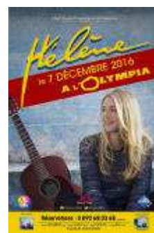
Affiche du spectacle « Hélène à l'Olympia »

Les places sont réparties en 3 catégories, avec un prix de vente compris entre 75 € et 35 €, et un tarif intermédiaire à 55 €.