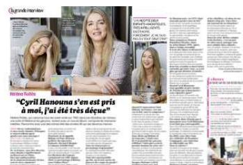
Une double page dans « Closer »

Bien sûr, la sortie du disque est également relayée dans la presse et sur les sites d'information . Elle accorde plusieurs interviews comme, par exemple, pour le magazine digital IdolesMag.com , le site de Télé Loisirs ou le magazine Closer . Ce dernier lui consacre une double page dans son numéro en kiosques le 26 mai.